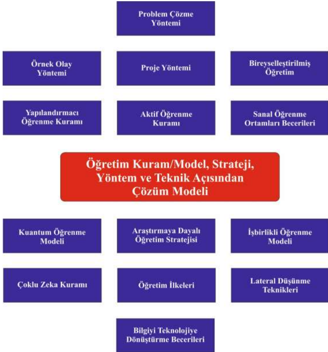
Şekil 1. Türkiye'nin Eğitim Açısından Bilgi Toplumu Yapısına Geçişini Sağlayacak Öğretim Kuram-Model, Strateji Yöntem ve Teknikleri Açısından Çözüm Modeli

Türkiye'nin eğitim açısından bilgi toplumu yapısına geçişini sağlayacak öğretim kuram-model strateji yönetim ve teknikleri açısından çözüm modelini incelediğimizde; problem çözme yöntemi,